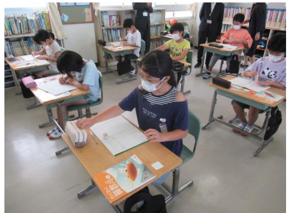
平行のある四角形について学習していました