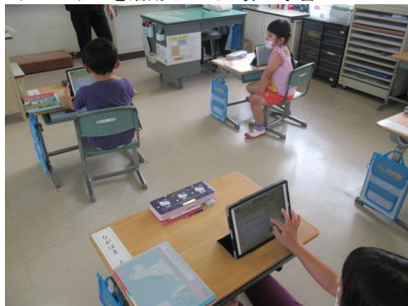
タブレットを活用してたし算の学習