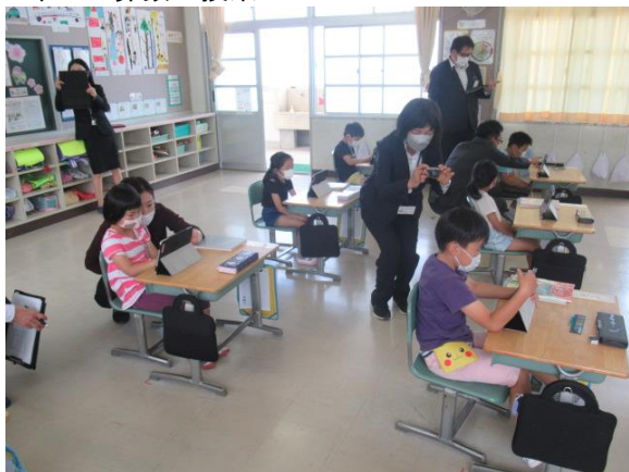
1年生の算数の授業