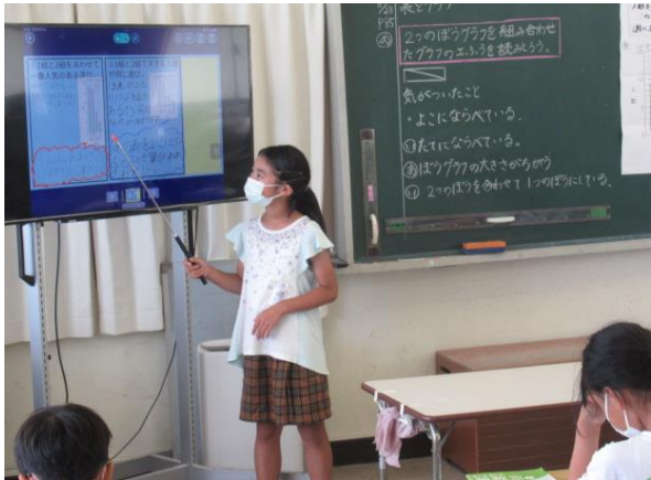
表とグラフの説明をしていました