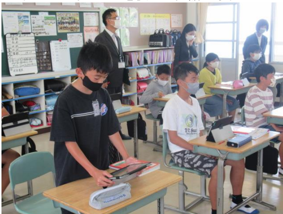
6年生は思考ツールを使って国語の学習