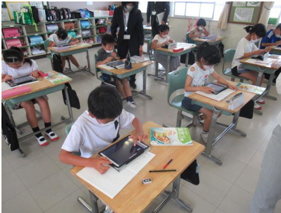
3年生の算数の授業