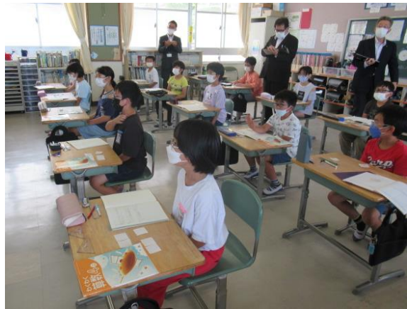
4年生の算数の授業