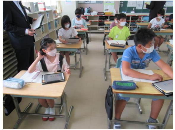
言葉を組み合わせて文章を作っていました