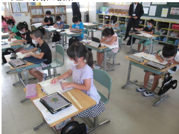
2年生の算数の授業