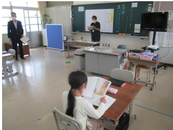
ひまわり2組の国語の授業