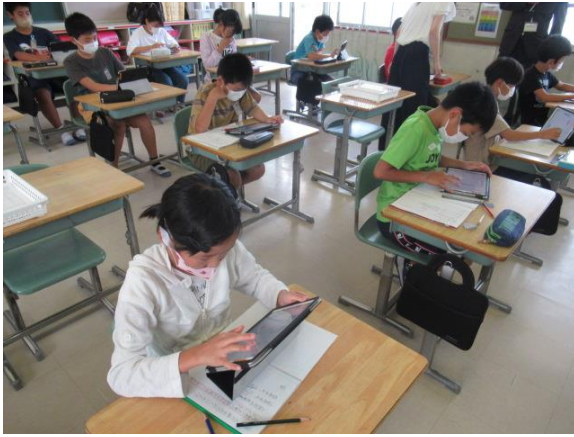
5年生の国語の授業