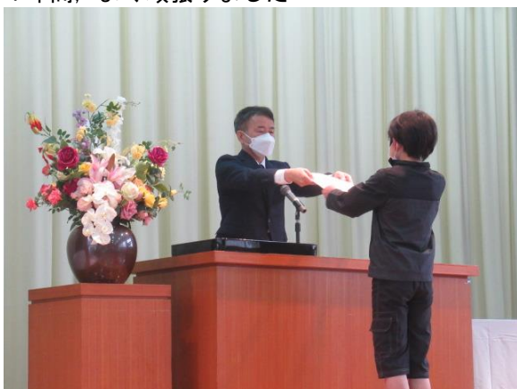
1年間、よく頑張りました