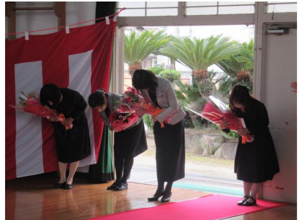
益々活躍されることを祈念します 感謝 感謝です