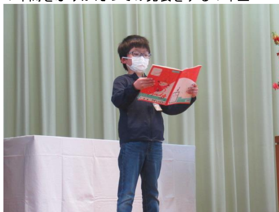
1年間をふりかえっての発表をする1年生