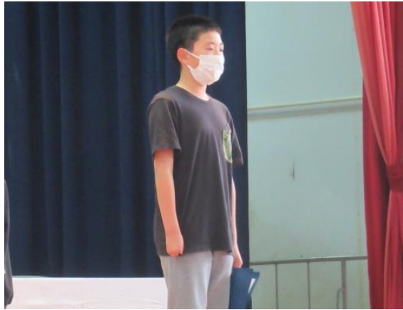
5年生の発表 広南小のリーダーとして頑張ります