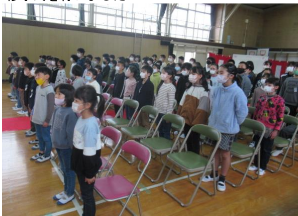
修了式を行いました