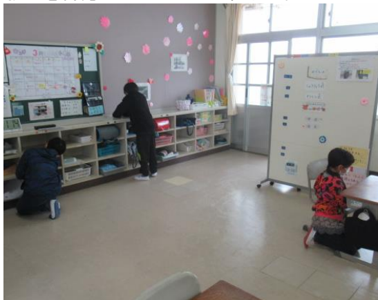
教室を綺麗にしていたひまわり2組