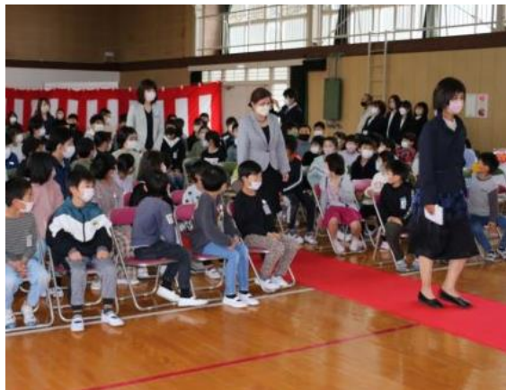
送別式を行いました 璃退任者入場