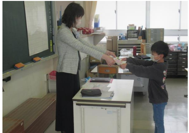
担任から手紙をいただく2年生