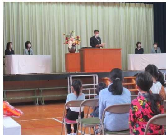
校長がお別れの挨拶