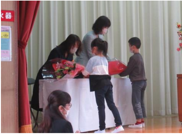
今までありがとうございました