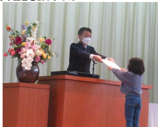
修了証書を渡しました