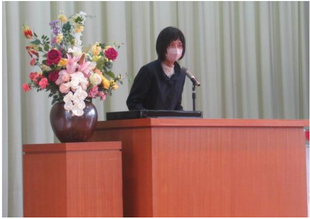
退職者の挨拶 広南小学校で退任できて幸せです