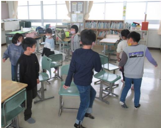
楽しく椅子取りゲームをしていた1年生