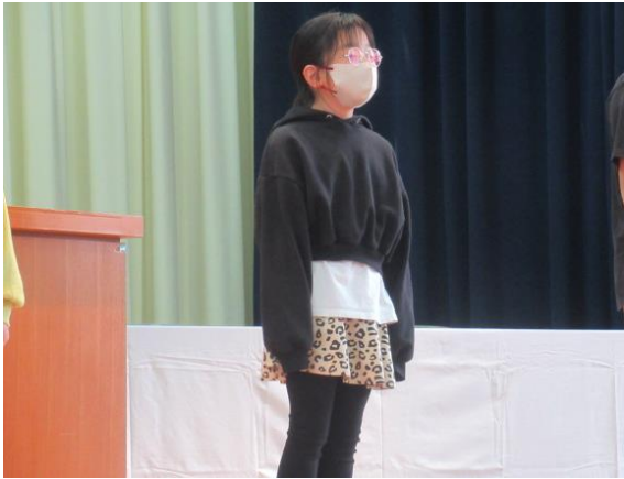
4年生の発表 二分の一成人式を頑張りました