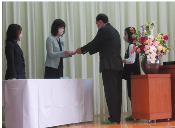
P T A から記念品贈呈