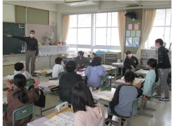
ジョシュア先生と外国語の学習