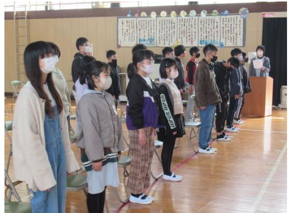
良い姿勢で練習していました