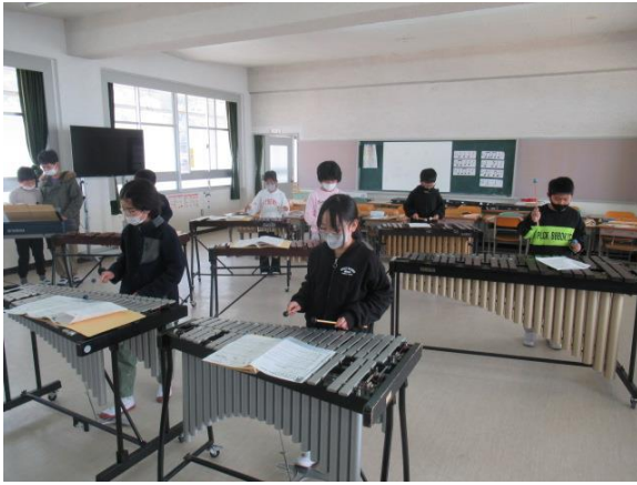
合奏の練習をしていた4年生