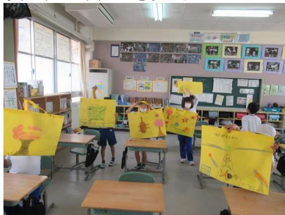
オリジナルバッグができました