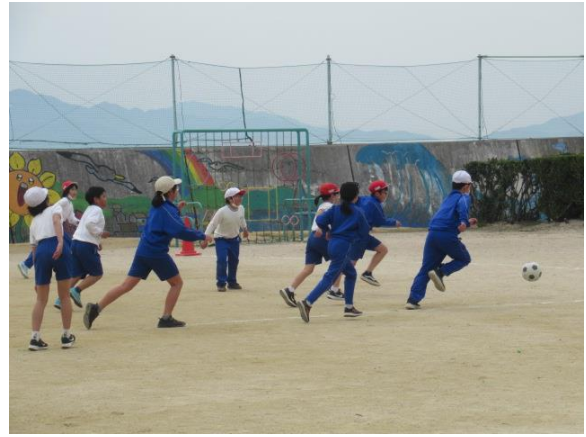
体育でサッカーをしていました