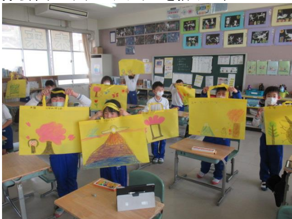
持ち帰りバッグにデザインを描く2年生