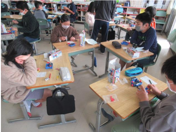
理科で、電磁石の実験を行う5年生