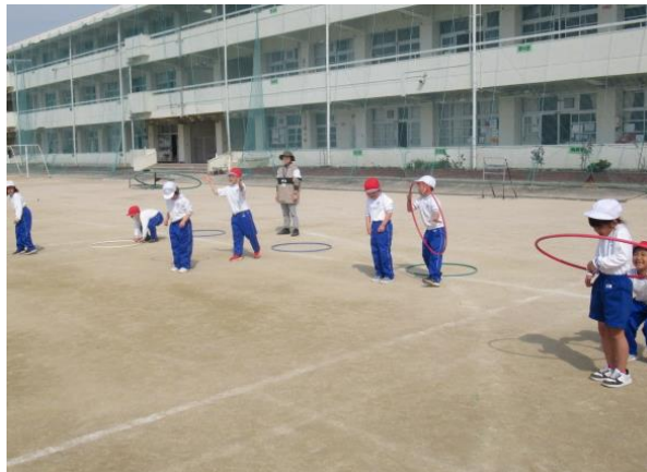
楽しそうなりレーをしていました