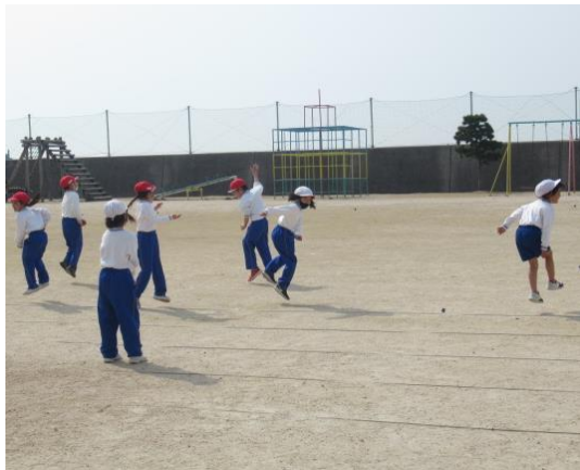
体育で体ほぐしの運動を行う1年生