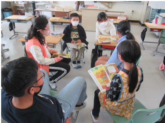
外国語活動を楽しむ3年生