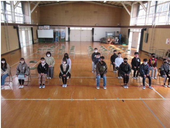
卒業式の練習を行う6年生