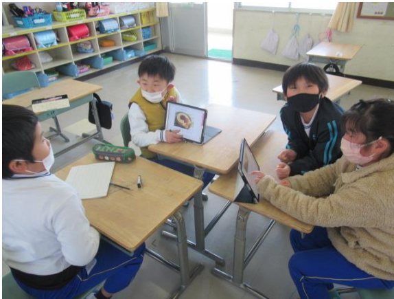
国語で調べ学習を行う2年生