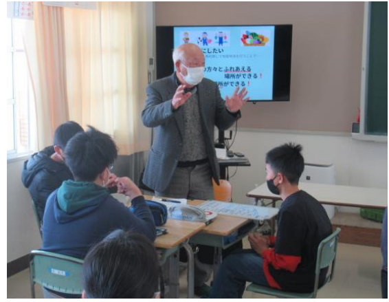
今よりもっと楽しく夢や希望が広がる町を作ろう