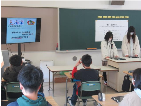
地域の方とふれあえる町づくりについて発表