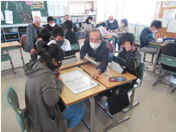
小坪の未来について、意見交流をしました