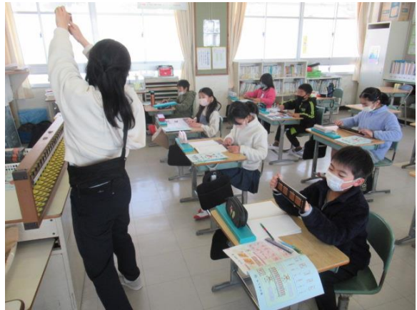
そろばんの学習を行う3年生