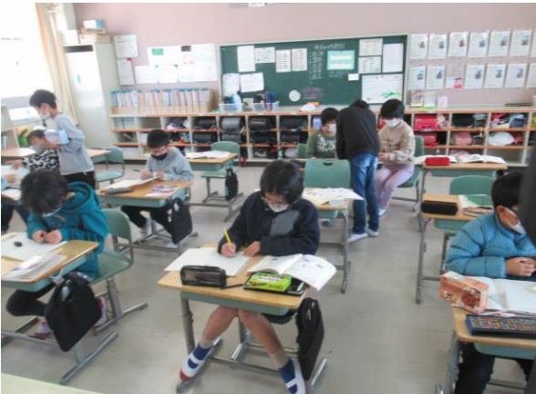
算数の練習問題を行う4年生