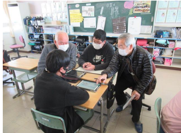
地域の魅力を伝えるために、意見交流をしました