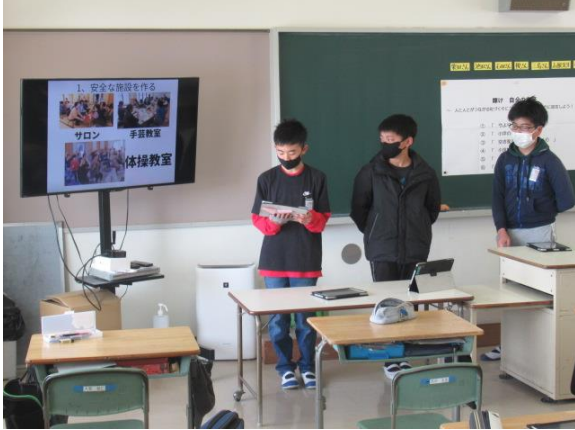
地域の方に未来の町づくりについて発表する6年生