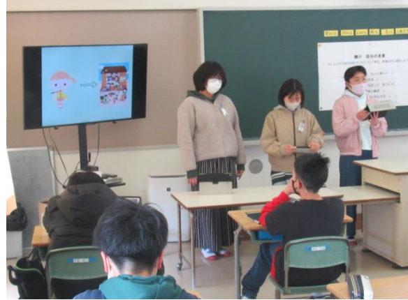
空き家を使った町づくりを発表