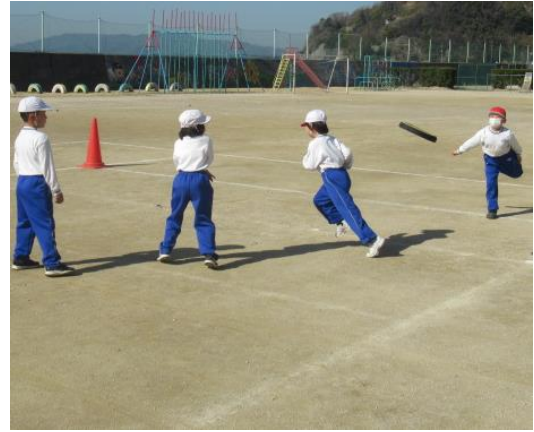
フリスビードッジを行う1年生