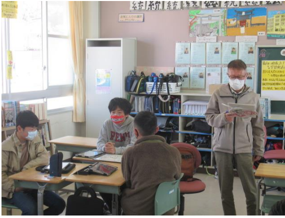
小坪神楽の継承について意見をいただきました