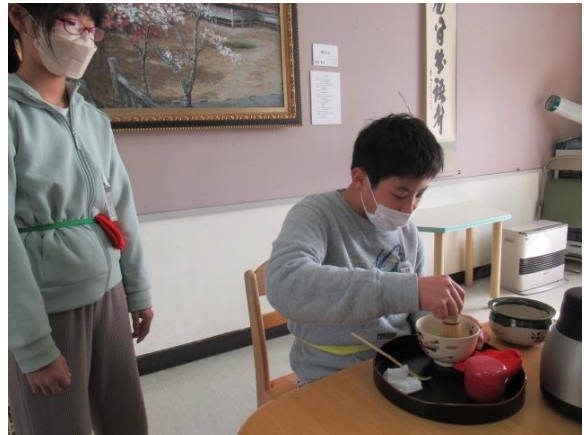
先生のお茶をたてるので緊張していました