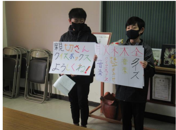
放送委員会の給食放送は楽しみですね