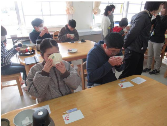
美味しくいただきました