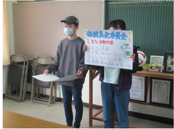
保健美化委員会は、コロナ対策に努めていました