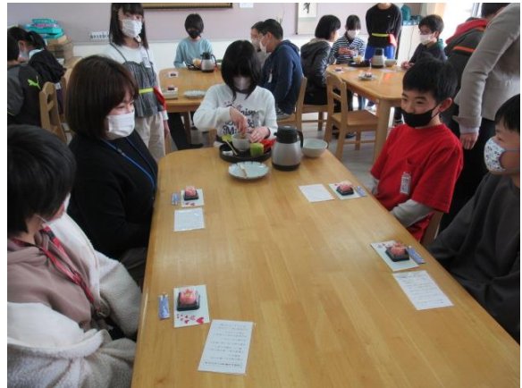
お点前が上手になっていました