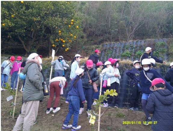
3年生は、初めて里山に来ました