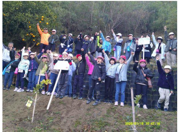
里山プロジェクト、頑張るぞ！！