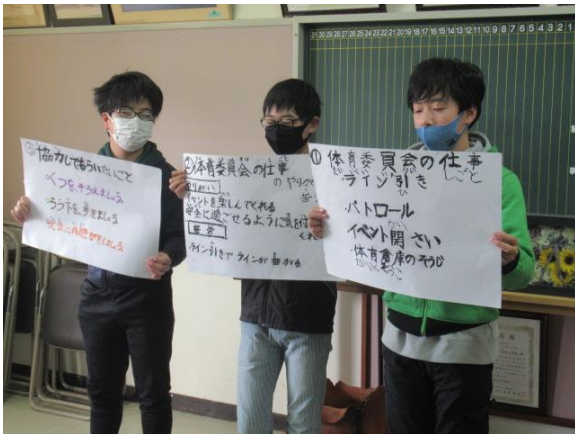
体育委員会は、ライン引きなどを頑張りました