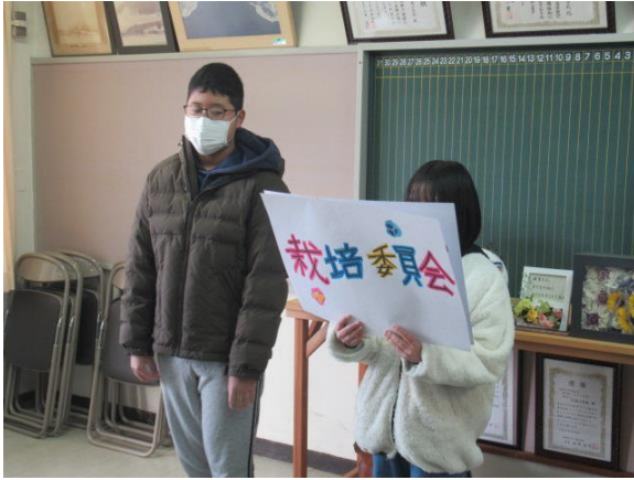
児童朝会で、栽培委員会の活動報告