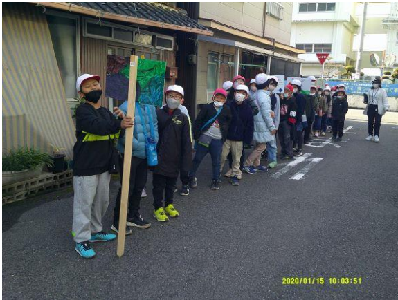
里山に出発します