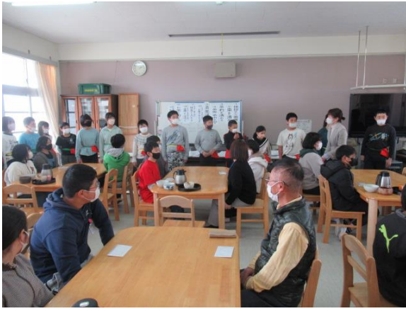
5年生が6年生を招待してのお茶会