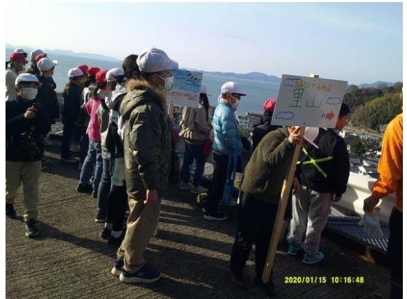
休憩して、町を見下ろします