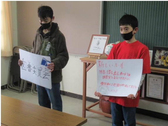
図書の貸し出しを行ってくれた図書委員会