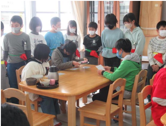
お先にいただきます