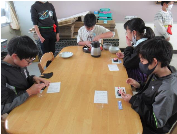
心を込めてお茶をたてました