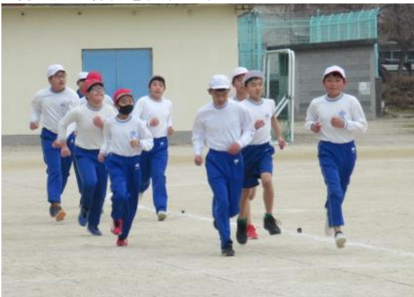
持久走の練習を行う6年生