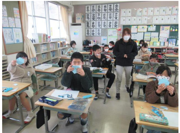
六角形ができていました