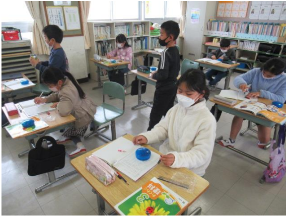
理科で、磁石のはたらきを学習する3年生