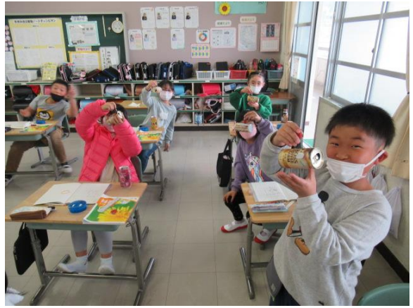
スチール缶は、磁石にくっきました