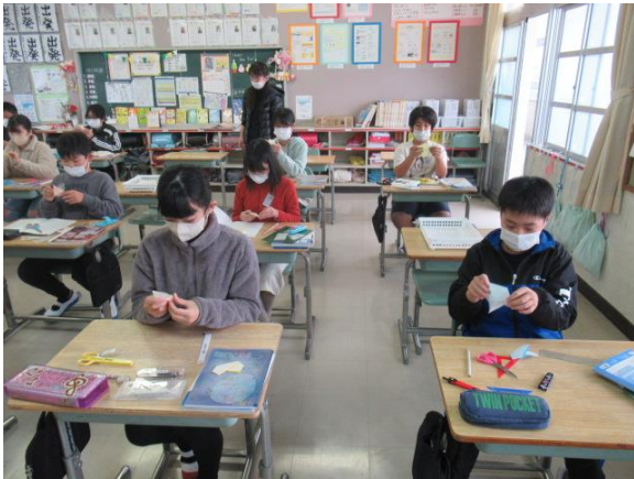
算数で、色紙を切って図形を作る5年生