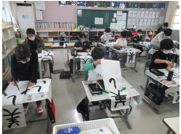
心を込めて一生懸命書いていました