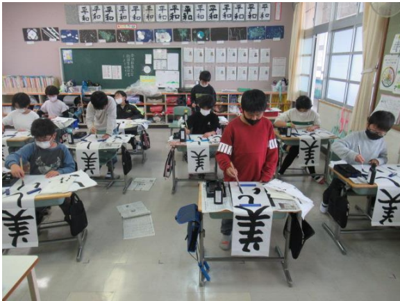
書初めで「美しい空」を書く4年生