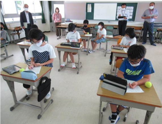
音楽で、旋律の特徴を考える4年生