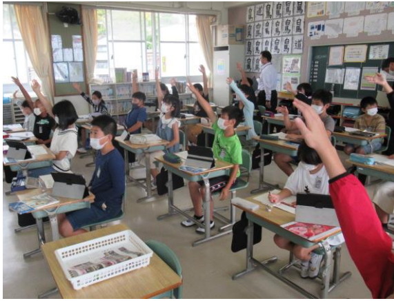
算数で、意欲的に発表する5年生