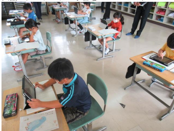
国語で、カタカナの学習をしていた1年生