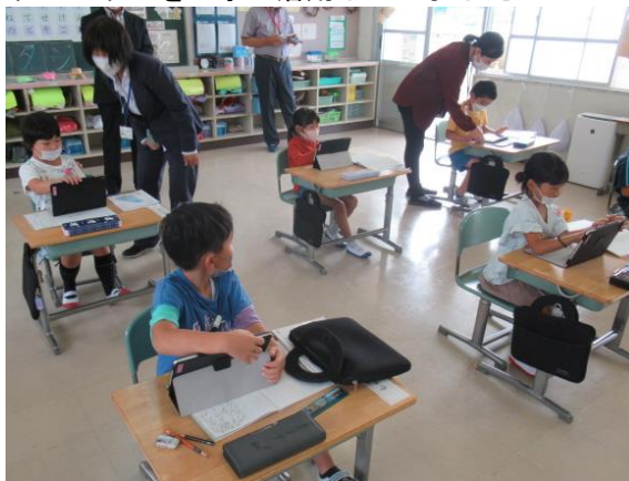
タブレットを上手に活用していました