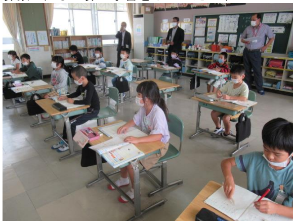
算数で、ひっ算の学習をしていた2年生