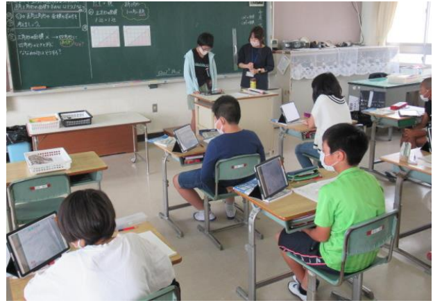
自分の考えを発表していました