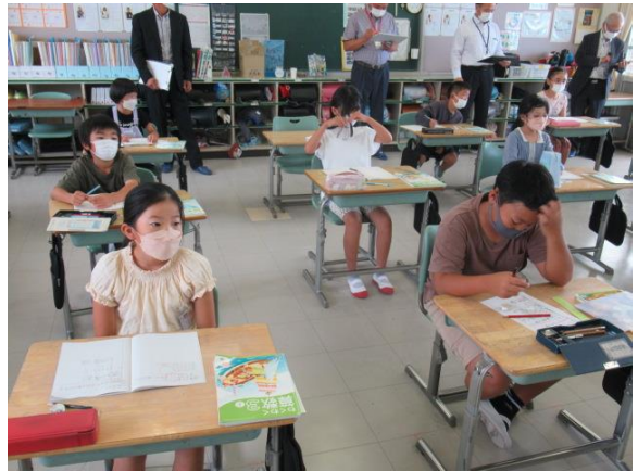
図を書きながら考えていました