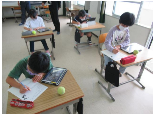
タブレットで音楽を聴きながら考えていました