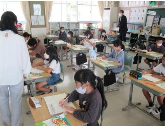
算数で、何倍になるかの学習をしていた3年生