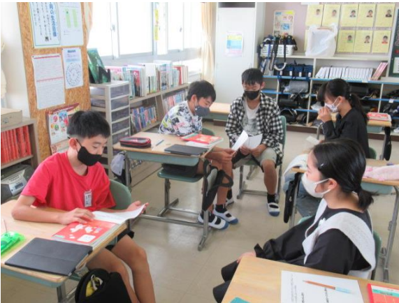
国語で場面に応じた言葉づかいを学習する6年生