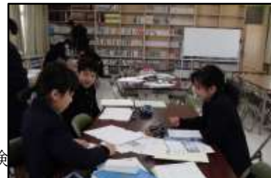
図書室での情報収集