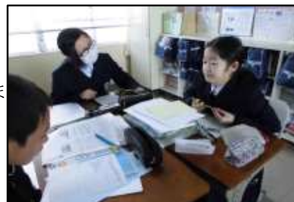
情報を分析し「虎の巻」作成中