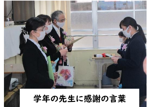
学年の先生に感謝の言葉