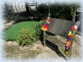
7.9広南防災の日「誓いの碑」