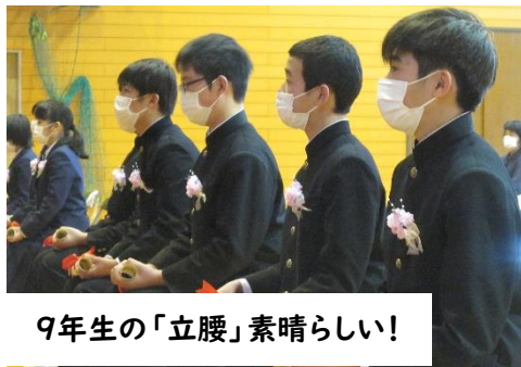
9年生の「立腰」素晴らしい!

昨年度に引き続き、コロナウイルス感染症対策として、当日は、卒業生、保護者、教職員のための簡素な式となりましたが、さすが9年生!呼名の返事も大きく、「立腰」の座り方の姿勢など、本校の伝統である礼節を重んじた、素晴らしい式となりました。本来であれば、地域の方にも見守っていただき、卒業生からも感謝の気持ちを表現するところですが、実現できず残念です。来年度はぜひ地域の皆様とともに式を迎えたいものです。