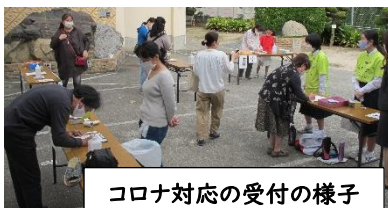
コロナ対応の受付の様子

子どもたちの教育活動費として大切に利用させていただきます。ご協力ありがとうございます。