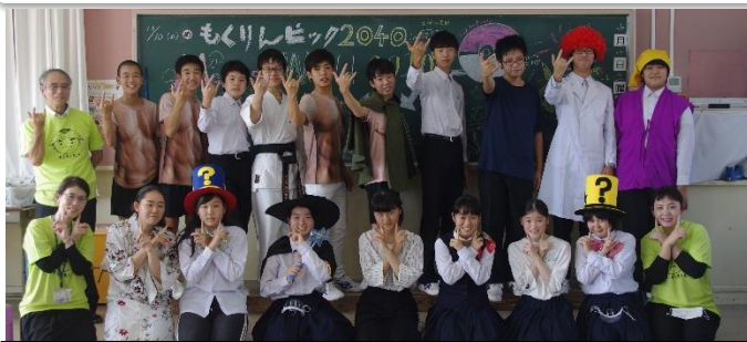
9年生! 全員でやりきった後の笑顔は最高!どの学年もドラマが。