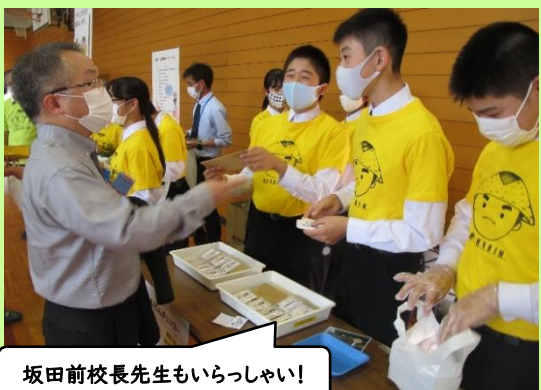
坂田前校長先生もいらっしやい！

【9年】 コロナだからこそ、人とのつながりをテーマにした創作劇「もくリンピック2020～世界の人とつながろう～」。地域の方に未来を見つめ、世界とつながる素晴らしさを伝えることができました。