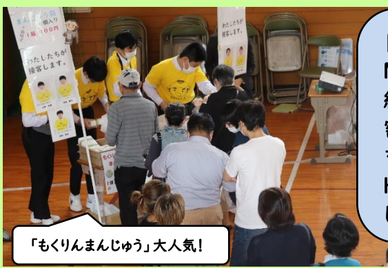
「もくりまんじゅう」大人気！

【8年】「起業企画HMII」で漫才の商品紹介や体育館で三密の対策をした販売を行いました。HMIIの皆さん、頼もしかったですよ。