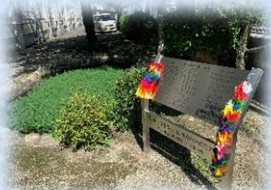
7.9 広南防災の日「誓いの碑」