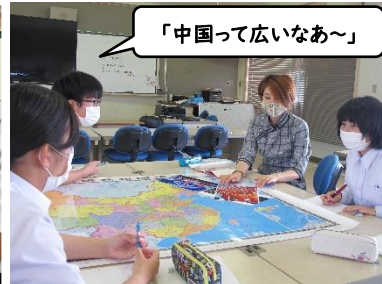
「中国って広いなあ〜」