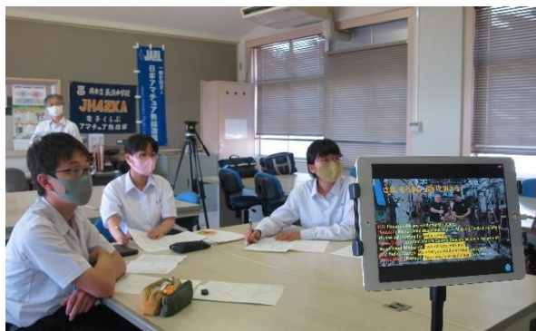
オンラインで世界、いや宇宙と交流! 広南中生やるね~

※当初は、令和2年7月2日(木)~12日(日)の11日間で、アメリカ合衆国アラバマ州ハンツビル宇宙ロケットセンターにてスペースキャンプに参加し、英語の授業で実際に宇宙飛行士の訓練体験などをする予定でしたが、コロナウイルス感染症を受けて入国できなくなりました。その後、JAXA 筑波宇宙センターにて2泊3日の研修を行う代案となったのですが、これも関東の感染状況を受け中止となり、今回、各学校からリモートにより交流することになりました。コロナの中でも、可能な限り交流してほしいと力を尽くしてくださった全ての皆様に感謝します。