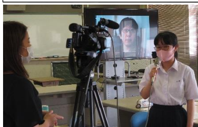
テレビや新聞の取材にも堂々と対応!「すばらしい表現力!」(^_^)