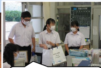
小学校で商品宣伝「やはり職員室は緊張するなあ〜」

【9年】「創作劇」で地域貢献です。今年のタイトルは「もくりんピック2020〜世界の人とつながろう〜」。東京オリンピックは延期となりましたが、広南では、もくりんピックを開催します。もくりんピックって何？何？観てのお楽しみ♡