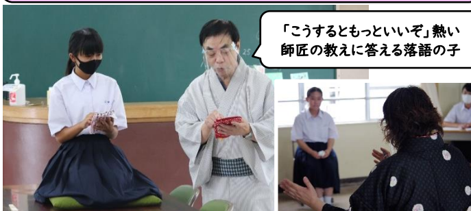
「こうするともっといいぞ」熱い師匠の教えに答える落語の子

【7年】古典芸能「落語」の披露と映像で地域に笑顔をお届けます。今年も個性豊かな落語の子が生まれました。