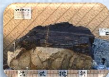
探究のシンボル「マローンストーン」