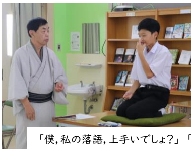
「僕、私の落語、上手いでしょ?」「広南中の生徒は、なかなかやるなあ～」

2年 起業企画(本物から学ぶ)洋菓子のかずっちゃん、和菓子の博美屋、がんすの三宅水産とのコラボ商品ぞくぞく開発中!