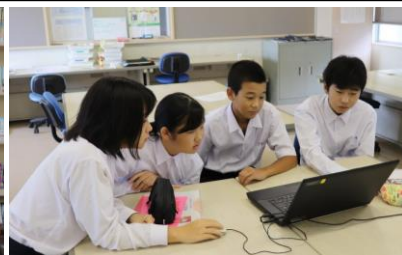
出資金のお願いに向けて 戦略を練る総務部