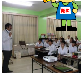
「津波の被害」広島商船高等専門学校の出前授業