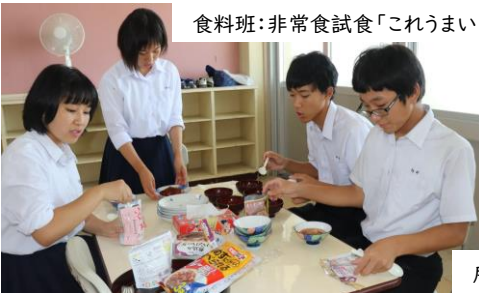
食料班:非常食試食「これうまい!」