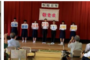
実行委員:長浜敬老会で宣伝!