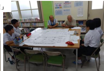
居住班:地域防災リーダーと3階避難所部屋割り協議