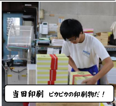
当田印刷 ピカピカの印刷物だ!