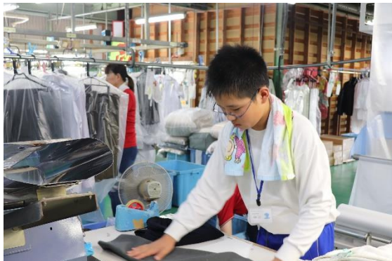
小柴クリーニング お客様の衣類は丁寧に よいよ!

<参加生徒>◎5日間でうれしかったことは、袋詰めをした際、お客様が「頑張ってるね!」と声をかけて下さったことです。(女子)