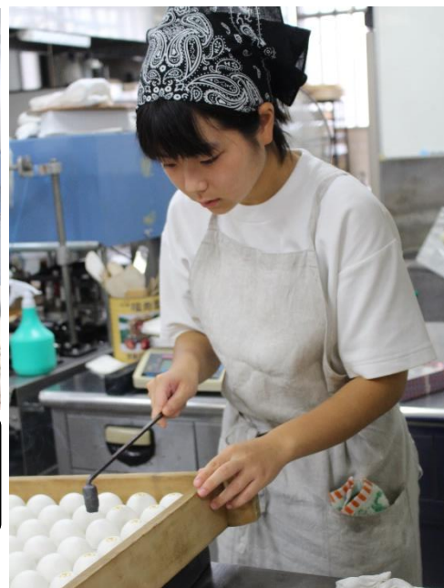
椿庵博美屋 もぐりん饅頭焼き印 緊張するね

<参加生徒>◎5日間でうれしかったことは、袋詰めをした際、お客様が「頑張ってるね!」と声をかけて下さったことです。(女子)