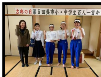
「古典の日 第5回呉市小・中学生百人一首大会」 優勝 会場 呉市立呉高等学校