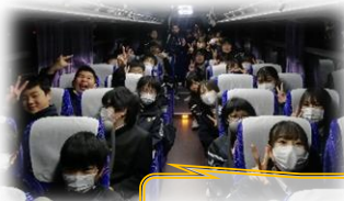
そうだ、関西へ行こう