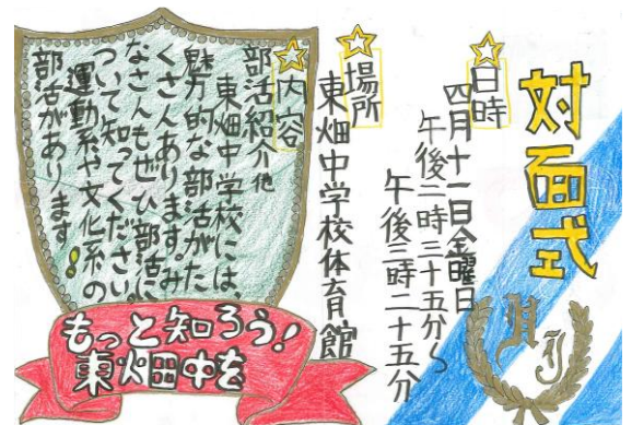
在校生から新1年生へ「対面式の招待状」