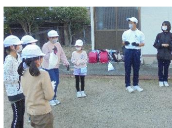
活動後の振り返りを行い、中学生と一緒にレクリエーションを楽しみました。(いずれも中学生の牽引でした。) クリーン活動後に小学生がお世話になった中学生に手紙を書いて届けました。