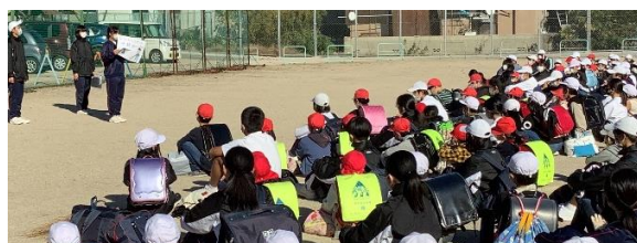
原小学校の卒業生3名がクリーン活動出発式の進行をしてくれました。とっても格好よかったです！