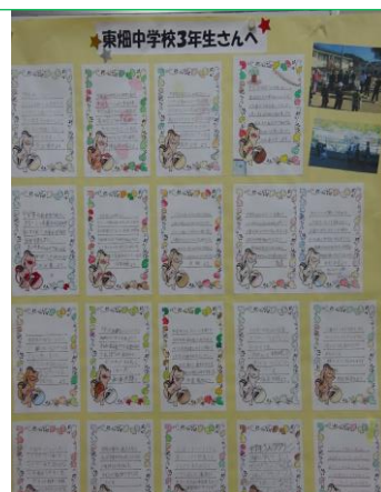
小学生から中学生へ感謝の手紙

今年度、東畑中学校区では「書く」活動を重視しています。小学生と中学生が、活動の前後にチラシや手紙等を「書いて」やりとりをする機会を設けることも、大切にしました。