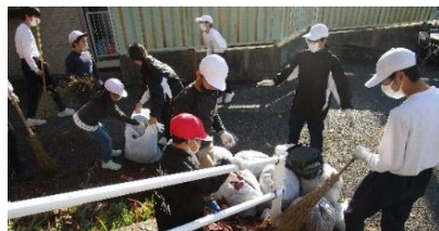
公園では中学生が小学生に教えながらたくさんのゴミを集めました。