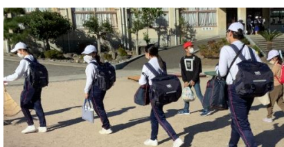
小学生と中学生混合のグループに分かれ、中学生の指示で各グループが担当の公園に移動しました。