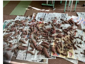
サツマイモ、こんなにとれたよ！