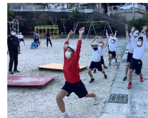
【中学生をお手本に頑張るぞ！】

10月28日（金）、陸上記録会の前日に、選手の壮行式を行いました。一人一人が今回の大会に向けて設定した目標を堂々と宣言しました。そして、その宣言通り、当日は全員が自己ベストを出すことができました。自分が立てた目標に向かって努力すること、達成感や時には悔しさも感じる経験はこれからの人生に必要なことです。これからも、こういった機会をたくさん作って「やればできるんだ！」と自信をもって進んでいける原っ子を育てていきたいと思ひます。