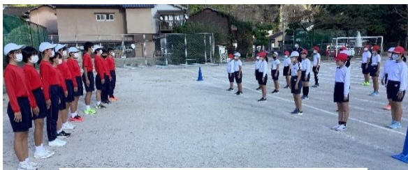
【これから中学生の指導を受けます】

東畑中学校区3校の活動も、復活しつつあります。10月29日（土）に開催された呉市陸上記録会に向けて東畑中学校陸上部の生徒が、母校原小学校に指導に来てくれました。