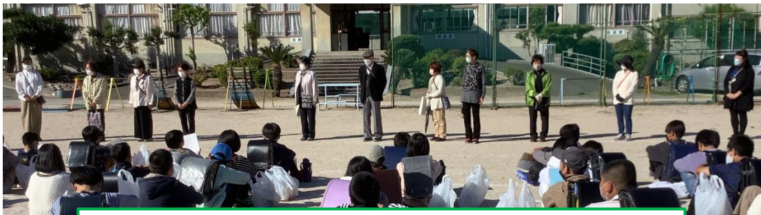
民生児童委員の皆様が学校にお越しくださり出発式を行いました。

花とハートを受け取って下さったお年寄りの方々も、ご協力下さった民生児童委員の皆様も、そして訪問させていただいた児童もみんな満面の笑顔だったと、ご一緒させていただいた本校の教職員が報告してくれました。