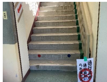
引き渡しの際，階段は一方通行に なります。その確認もできました。