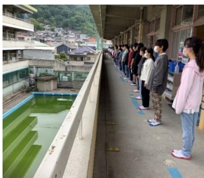
遠方凝視の後，中舎の3名と向かい 合い詩「雨にも負けず」の朗読 を行っています。

原小学校で30年以上続く「遠方凝視」は全校児童が朝の会の時間に一斉に廊下に並び遠くの山を1分間じっと見つめるという伝統の活動です。