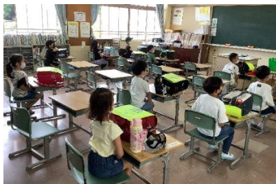
お迎えを待つ1年生，静かに待つ ことができるようになりました。