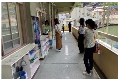
1年生の引き渡し訓練，保護者の方 がお迎えに来られました。