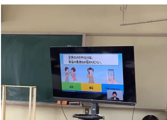
「文字だけのやりとりでは本当の気持ちは伝わりにくい」ですね！