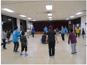
楽しかったキャンドルの集い