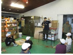
悪戦苦闘の火起こし体験