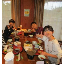
夕食いただきます！