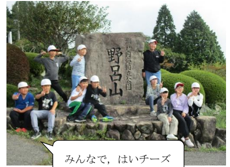
みんなで、はいチーズ