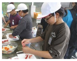
飯ごう炊飯でカレー作り