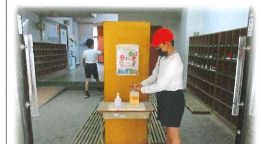
校舎の出入り口で消毒します