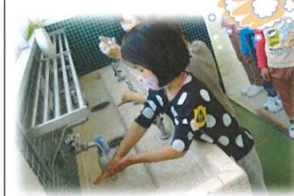
石けんでしっかり洗っています。