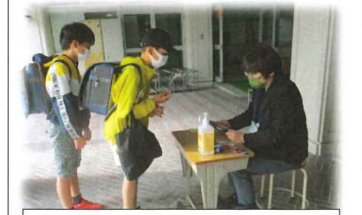
校舎に入る前にタブレット健康観察をしています。