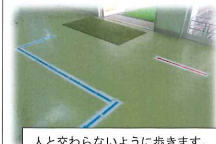
人と交わらないように歩きます。