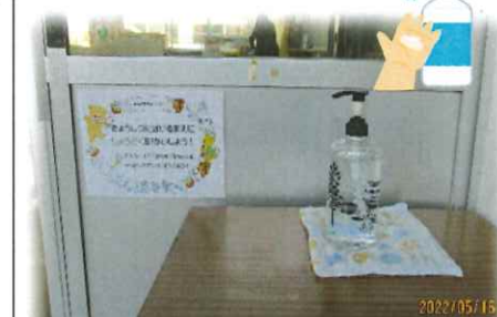
教室の出入り口で手指を消毒します。