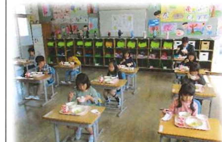
マスクを外す給食は、黙って食べます。