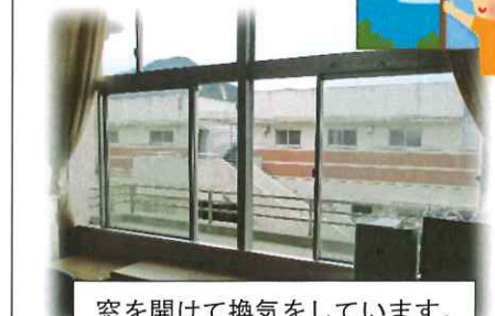
窓を開けて換気をしています。