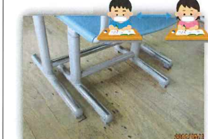
机の位置をマークし、児童机の間隔をとっています。