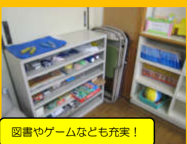
図書やゲームなども充実！