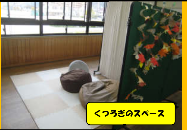
くつろぎのスペース