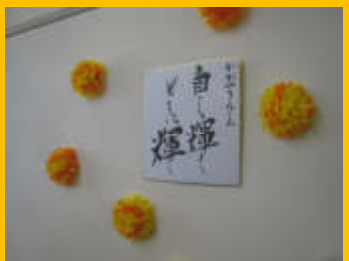
かがやきルーム担任からのメッセージ！