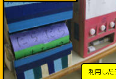
利用した子ども達の傑作が並んでいます！