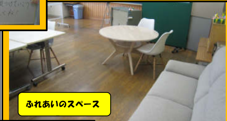
ふれあいのスペース