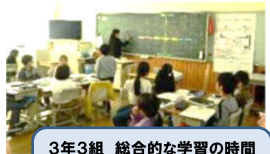
3年3組 総合的な学習の時間 「わたしたち ぼくたち 阿賀っ子探検隊！」