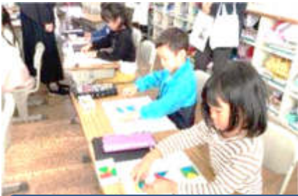
1年1組 算数科「かたちづくり」