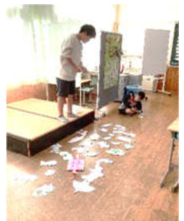
おおぞら1組 自立活動 「魚釣り大会をしよう」