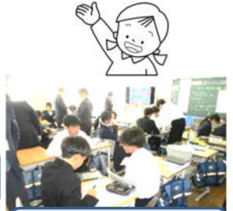
3年1組 数学科 「関数 y=ax^2 」