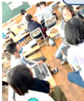
6年1組 特別の教科 道徳 「手品師」