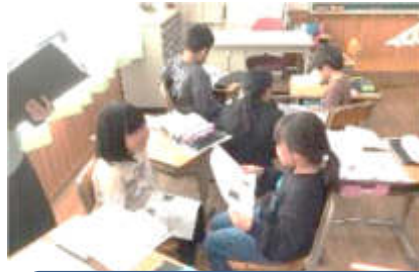
2年3組 国語科「お手紙」