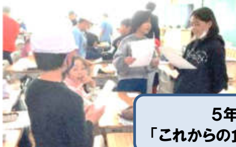
5年2組 社会科 「これからの食料生産とわたしたち」