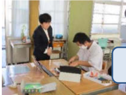
ハート2組 自立活動 「手作り校内を飾ろう」