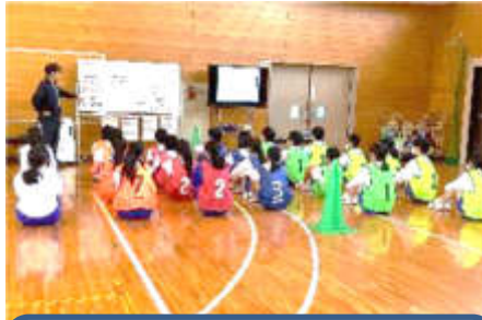
2年3組 保健体育科 「球技(ゴール型)『サッカー』」