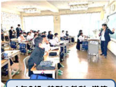
1年3組 特別の教科 道徳 「人のフリみて」