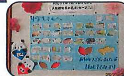
校内には在校生と卒業生からの温かいメッセージがあふれています。