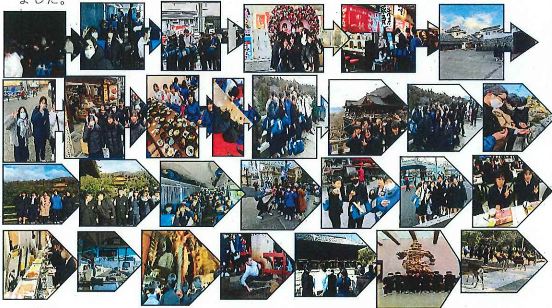
写真は一部抜粋して使用しております。そのほかの写真につきましては2学年から配布されるお知らせをごらんください。

2月6日から8日、三泊四日で京都、USJ(大阪)、奈良へ行ってきました。三日間とも天気に恵まれて、予定していた行程をすべて無事に終えることができました。